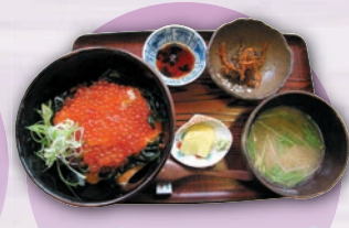
いくらサーモン丼 ¥4,000