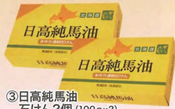
③日高純馬油 石けん2個 (100g x 2)