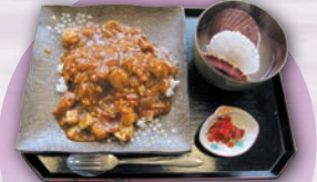
噴火湾ほたてカレー ¥2,000