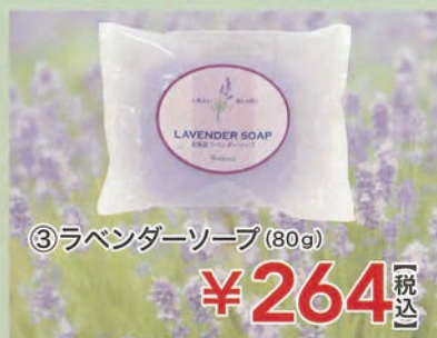
③ラベンダーソープ (80g)